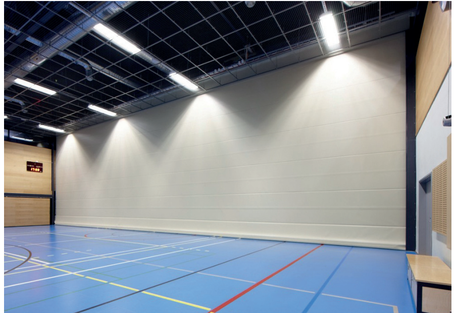
NS-30 poimuseinä, Latokartanon koulu

Pedelux vastaa seinien suunnittelusta, valmistuksesta ja asennuksesta.