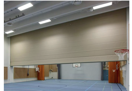
NS 30 poimuseinä, Vuorenmäen koulu ja päiväkot