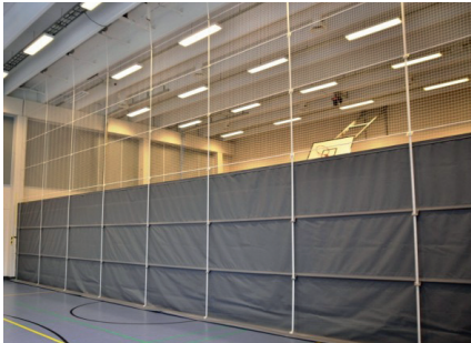
NS-10 kangas- ja -verkkoseinä